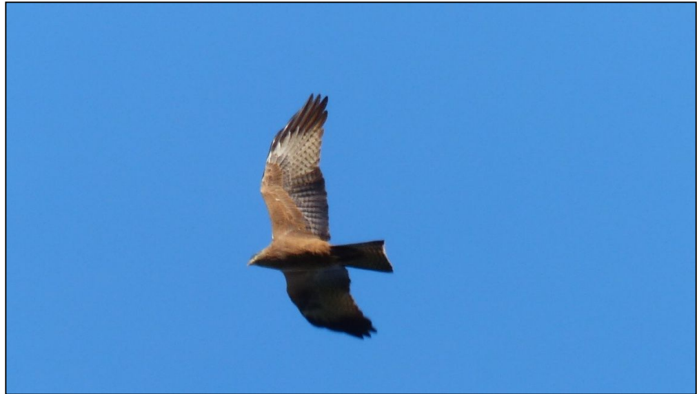
Schwarzmilan (Aufnahme vom Flugplatz Frei- burg, April 2014)