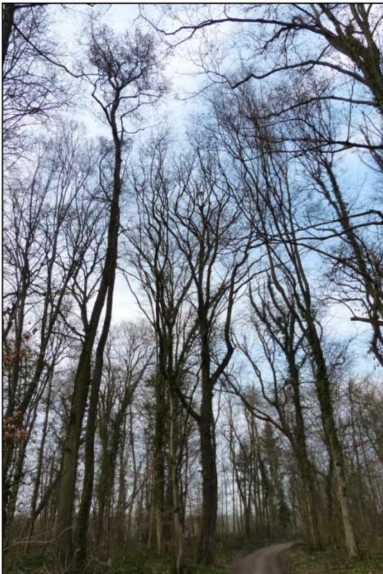
oben: Frühjahrsaspekt im Langmattenwäldchen

Die Ermittlung der Höhlendichte im Fronholz und Langmattenwäldchen zeigt einen hohen Anteil von höhlenreichen bis sehr höhlenreichen Waldbeständen (Spechthöhlen und Fäulnishöhlen). Nur einige jüngere Bestände weisen wenige oder keine Höhlen auf. Der kleine Waldbestand an der Abfahrt des Zubringers ist aufgrund starken Holzeinschlags mittlerweile sehr höhlenarm.