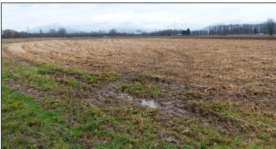
Nahrungshabitat von ca. 200 Hänflingen am 23. Jan. 2015 (Acker mit Ernteres-ten)

Die beiläufigen Zugbeobachtungen bei den Kartierungen zur Brutzeit lassen vermuten, dass die Bedeutung der Dietenbachniederung als Rasthabitat auf dem Durchzug durchschnittlich ist.