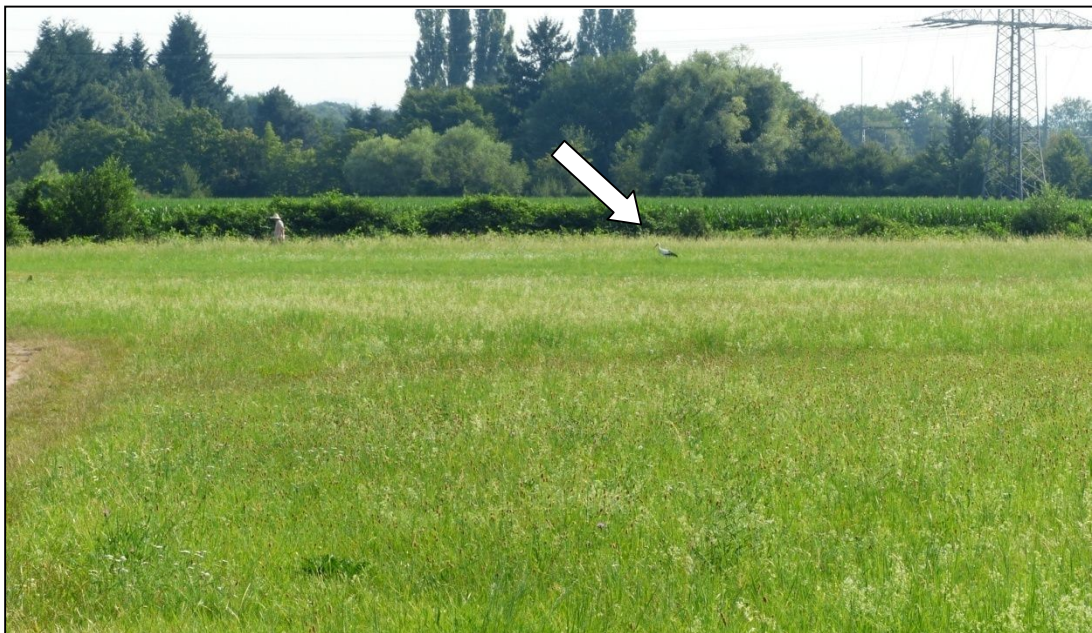
Wiese im zweiten Aufwuchs am 7. Juli in der Dietenbachniederung (schwach erkennbar im Hintergrund ein Nahrung suchender Weißstorch -siehe Pfeil)

Maßnahmenvorschläge: Der Fortpflanzungserfolg der Weißstörche hängt entscheidend von einem ausreichenden Nahrungsangebot im näheren Umfeld um den Horst-Standort ab (2 bis max. 3 km). Die relativ hohe Bedeutung des vergleichsweise kleinflächigen Grünlandes der Dietenbachniederung für den Weißstorch resultiert auch aus dem aktuell für den Weißstorch ungünstigen Grünland-Management im Rieselfeld. Man kann daher durch eine Anpassung des Grünland-Managements im Rieselfeld bedeutende Ressourcen für den Weißstorch erschließen. Vorrangig wäre hier eine Vorverlegung von Schnitt-Terminen sowie Streifenmähd mit Altgrasstreifen. Weitere geeignete Maßnahmen sind Extensivierung und Neuanlage von Grünland. Wo möglich, ist auch eine Wiedervernässung sehr erfolgversprechend. Sofern weitläufiges und zusammenhängendes Grünland im Teilgebiet 2 (Schildkrötenkopf) erhalten und aufgewertet werden kann, ist dies wahrscheinlich weiterhin vom Weißstorch nutzbar.