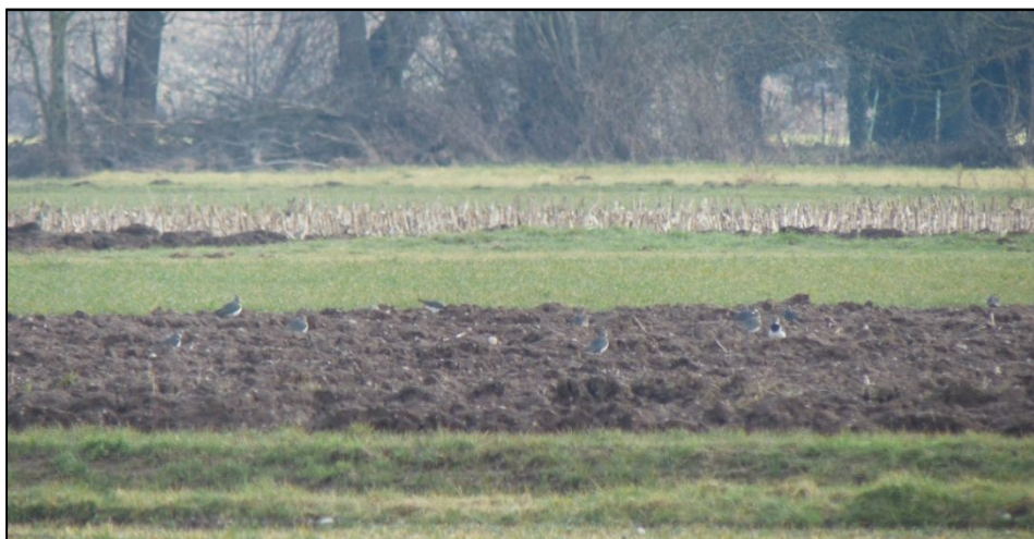
Trupp rastender Kiebitze auf Acker am 28.2.2015