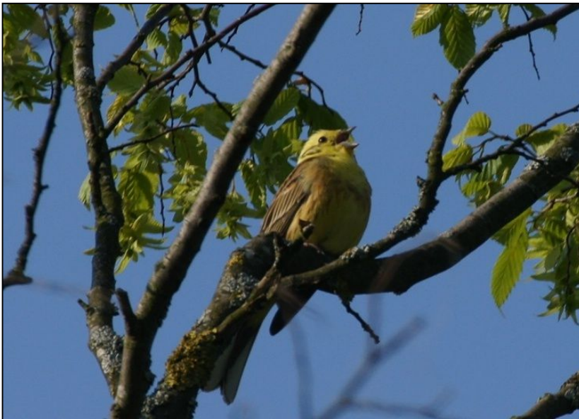
Singendes Goldammer-Männchen (Aufnahme aus Waldkirch)

Geeignete Maßnahme sind Extensivierung und Neuanlage von Grünland, das mit krautigen Saumstrukturen, Einzelbäumen und Hecken angereichert werden muss. Für Girlitz und Stieglitz sollte ein Teil der Maßnahmenflächen in Siedlungsrandbereichen angelegt werden, für beide Arten ist außerdem die Anlagen von samen tragenden Staudenfluren und Wildkrautfluren an Ackerrändern wichtig. Für die Goldammer können die Maßnahmenflächen teilweise in Synergie mit den Flächen für Schwarzkehlchen, Neuntöter und Dorngrasmücke angelegt werden. Es ist jedoch zu beachten, dass Schwarzkehlchen und Dorngrasmücke frühe Sukzessionsstadien von Saumstrukturen und Gehölzen benötigen, während Goldammer Habitate mit stärkerem Gehölzaufkommen bevorzugen.