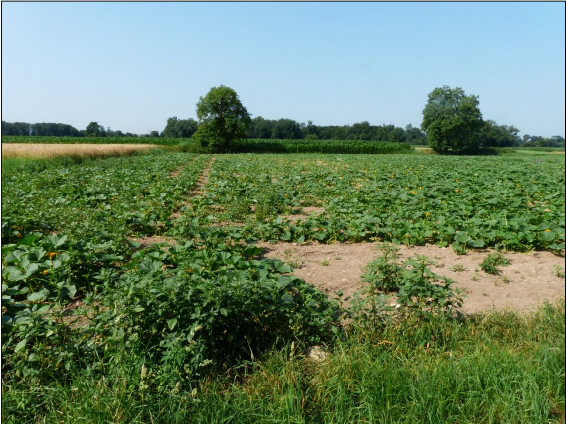
Wahrscheinliches Bruthabitat der Feldlerche bei einer Zweitbrut in der Dietenbachniederung Anfang Juli (lückige Kürbiskultur mit Grassaum).

Grauschnäpper (Karte 1.3): Besiedelt die Randstrukturen von älteren Laubwaldbeständen und vergleichbare Baumgruppen. Aus den Beobachtungsdaten wurden 2 Brutreviere in den Gehölzen am Zubringer, zwei Reviere im Langmattenwäldchen und eines im NW von Teilgebiet 1 gebildet. Wegen der späten Ankunft und dem unauffälligen Gesang, der mit Legebeginn aufhört, ist der Grauschnäpper eine schwer zu erfassende Art. Da die Männchen zum Beginn der Brutzeit in einem größeren Areal mögliche Brutplätze anzeigen, werden die Nachweise im Mai trotz des teilweise großen Abstandes zu den Nachweisen im Juni mit diesen zusammengefasst. Auf der Karte werden dann Juni-Nachweise als "Revierzentrum" dargestellt, da sich die Aktivität im Juni stärker auf den Nestbereich konzentriert als nach der Ankunft Mitte Mai.