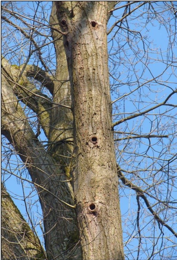
Größere Höhlen, wohl z.T. vom Grünspecht