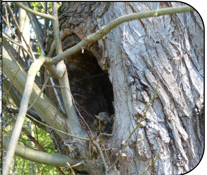
Große Fäulnishöhle in alter Baumweide am Dietenbach