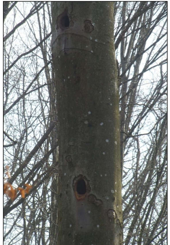
rechts: Frische Schwarzspechthöhle in Rotbuche - hier fand in 2015 eine Brut statt. Die obere Höhle im Baum stammt wahrscheinlich auch vom Schwarzspecht.